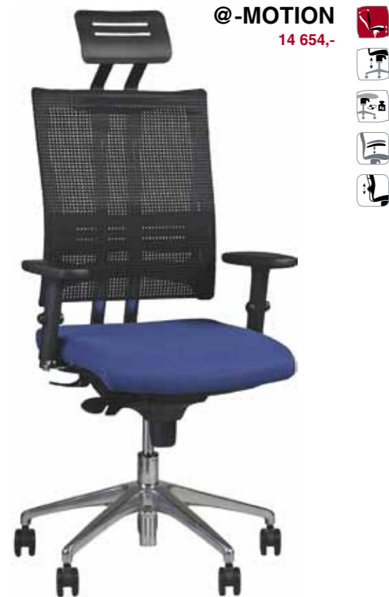
@-MOTION 14 654,-