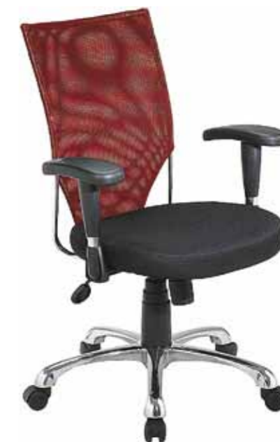
TRENTA 8 728,-