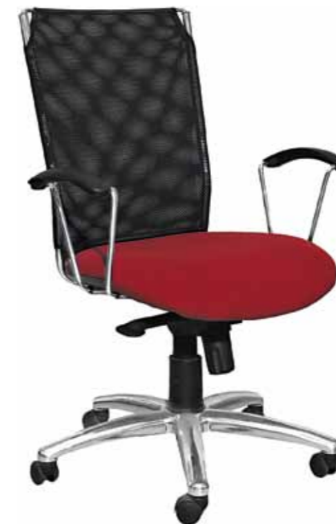
EVOLUTION 7 828,-