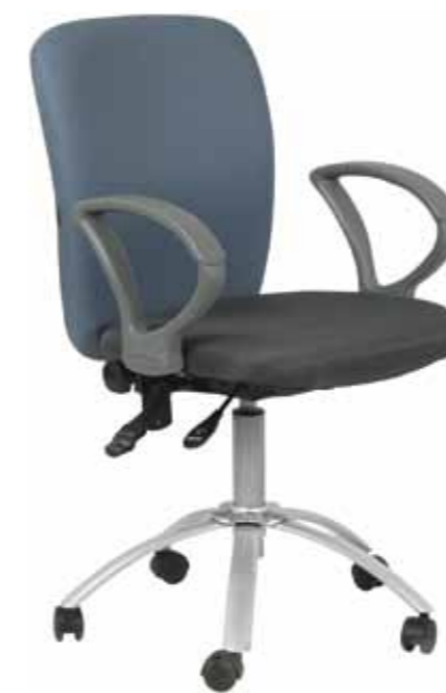
MILTON 5 635,-