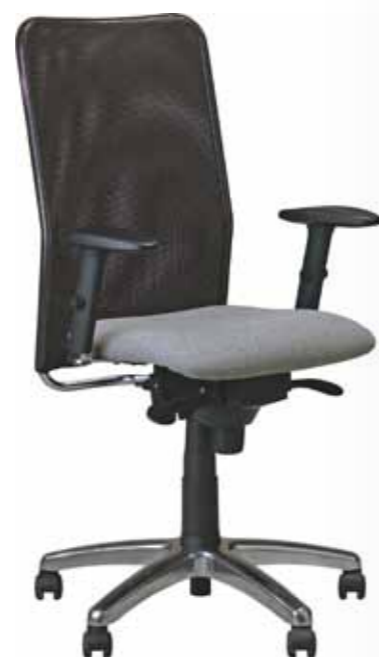
MONTANA 11 775,-