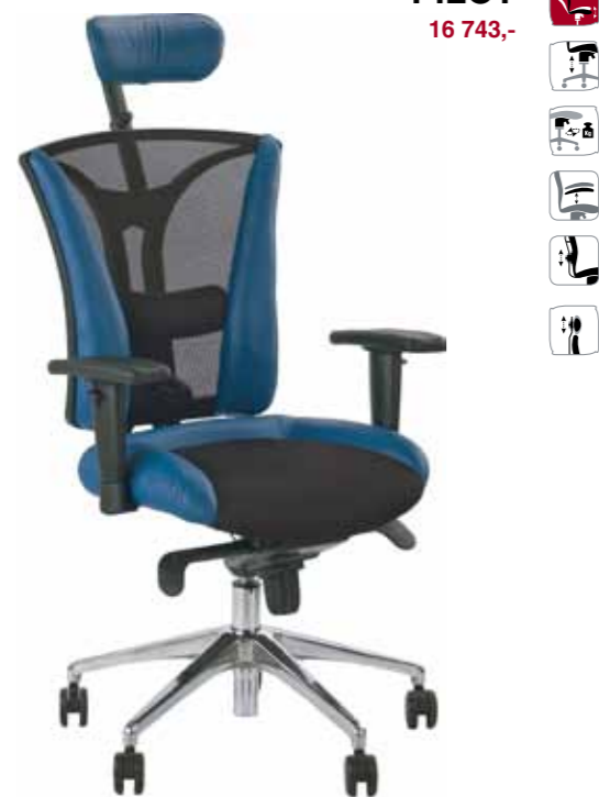
PILOT 16 743,-