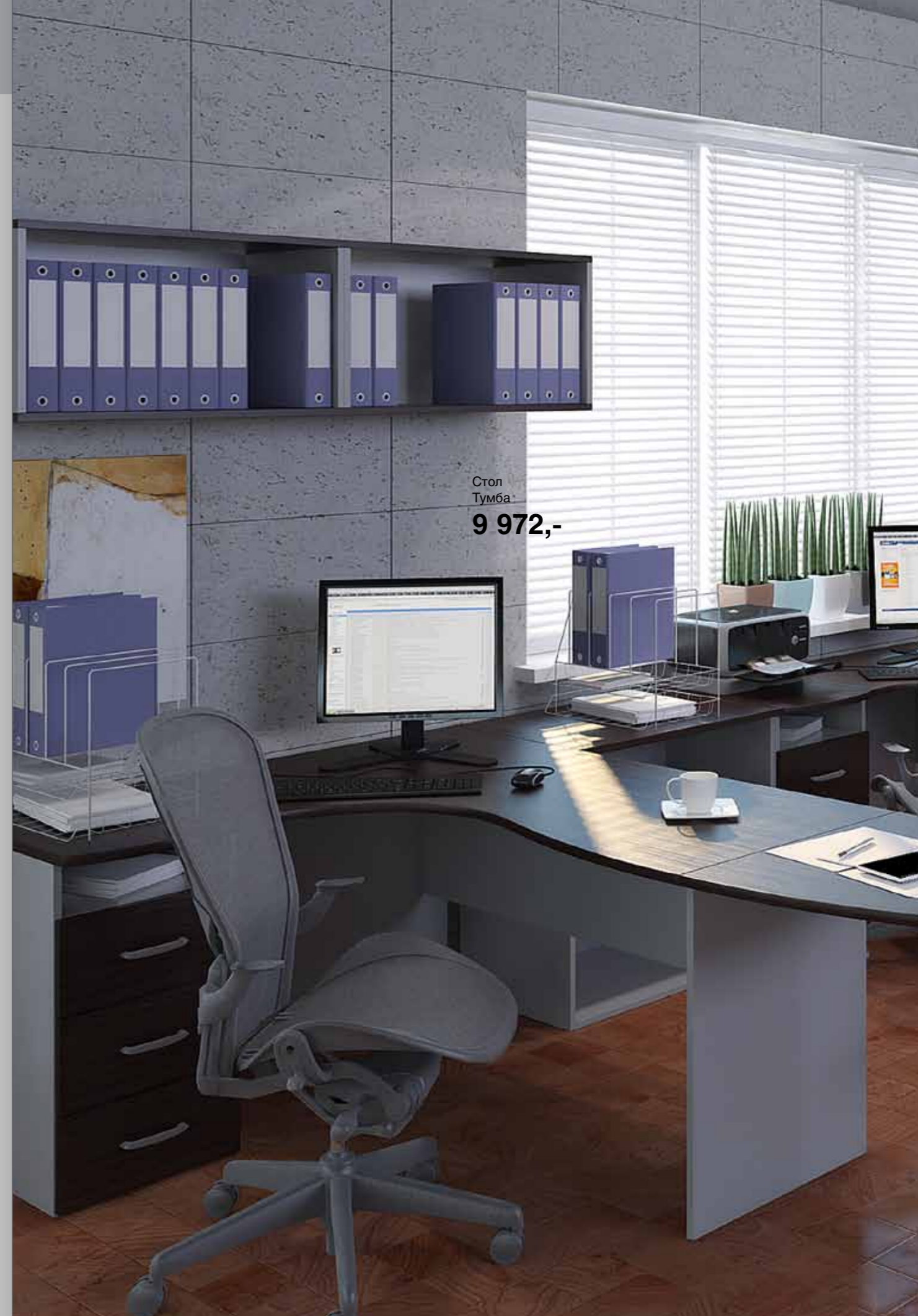
Стол Тумба 9 972,-

* Под заказ. Стоимость может быть выше указанной в прайсе.