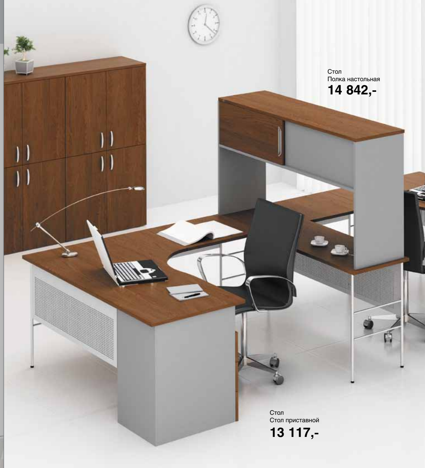
Стол Полка настольная 14 842,-