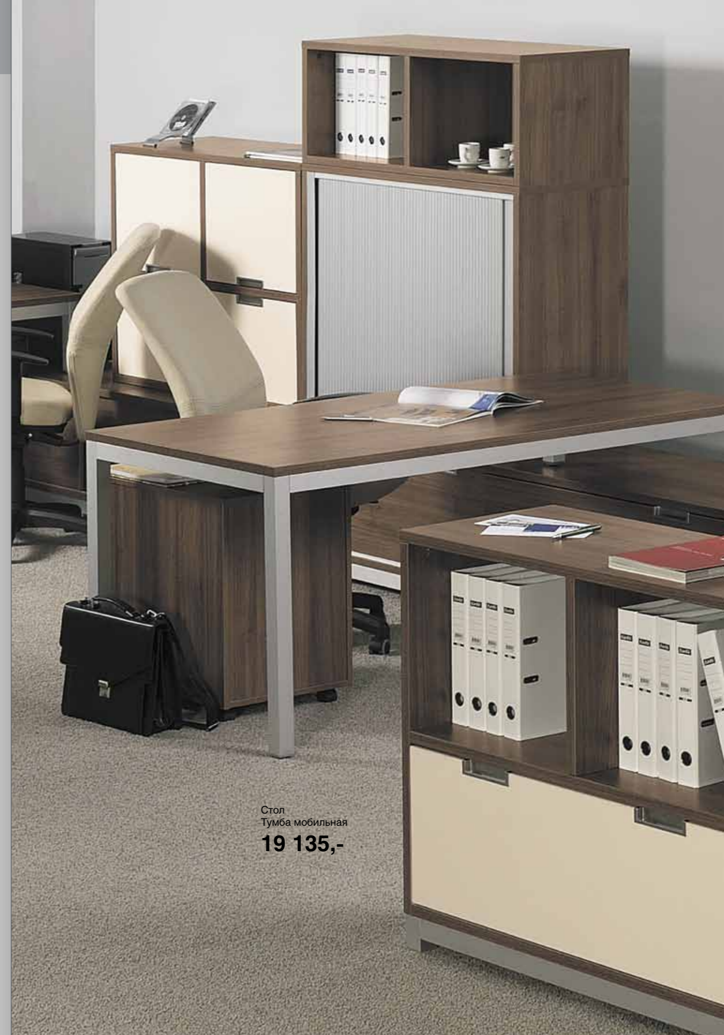
Стол Тумба мобильная 19 135,-

* Под заказ. Стоимость может быть выше указанной в прайсе.