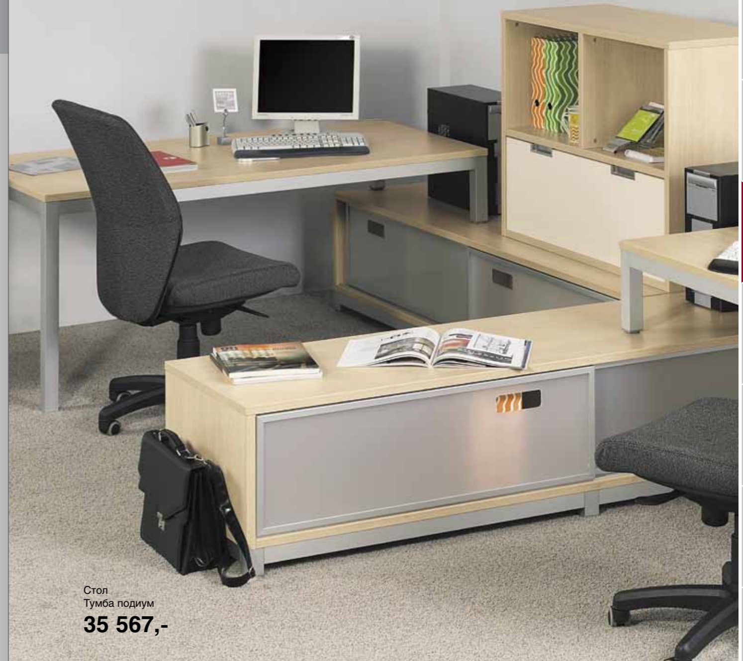
Стол Тумба подиум 35 567,-