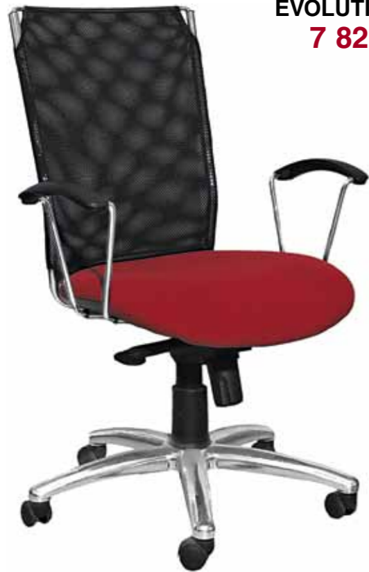
EVOLUTION 7 828.-