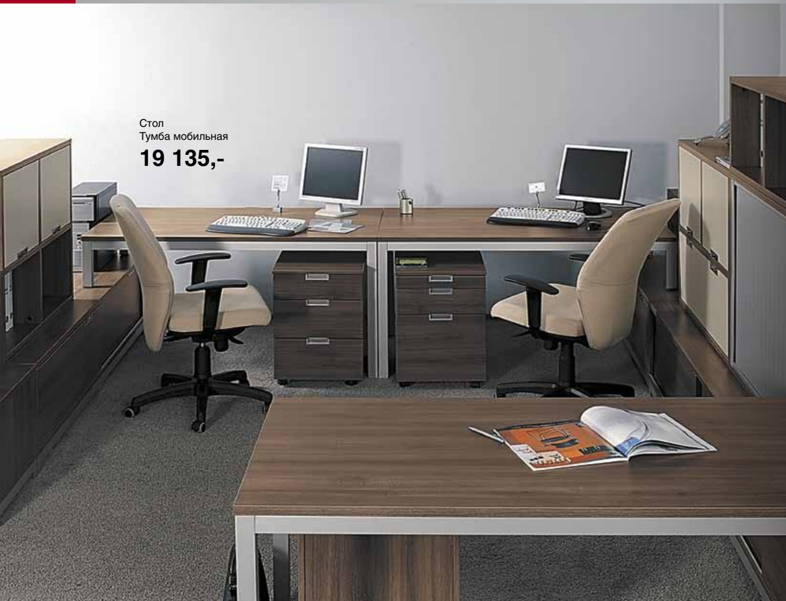
Стол Тумба мобильная 19 135,-