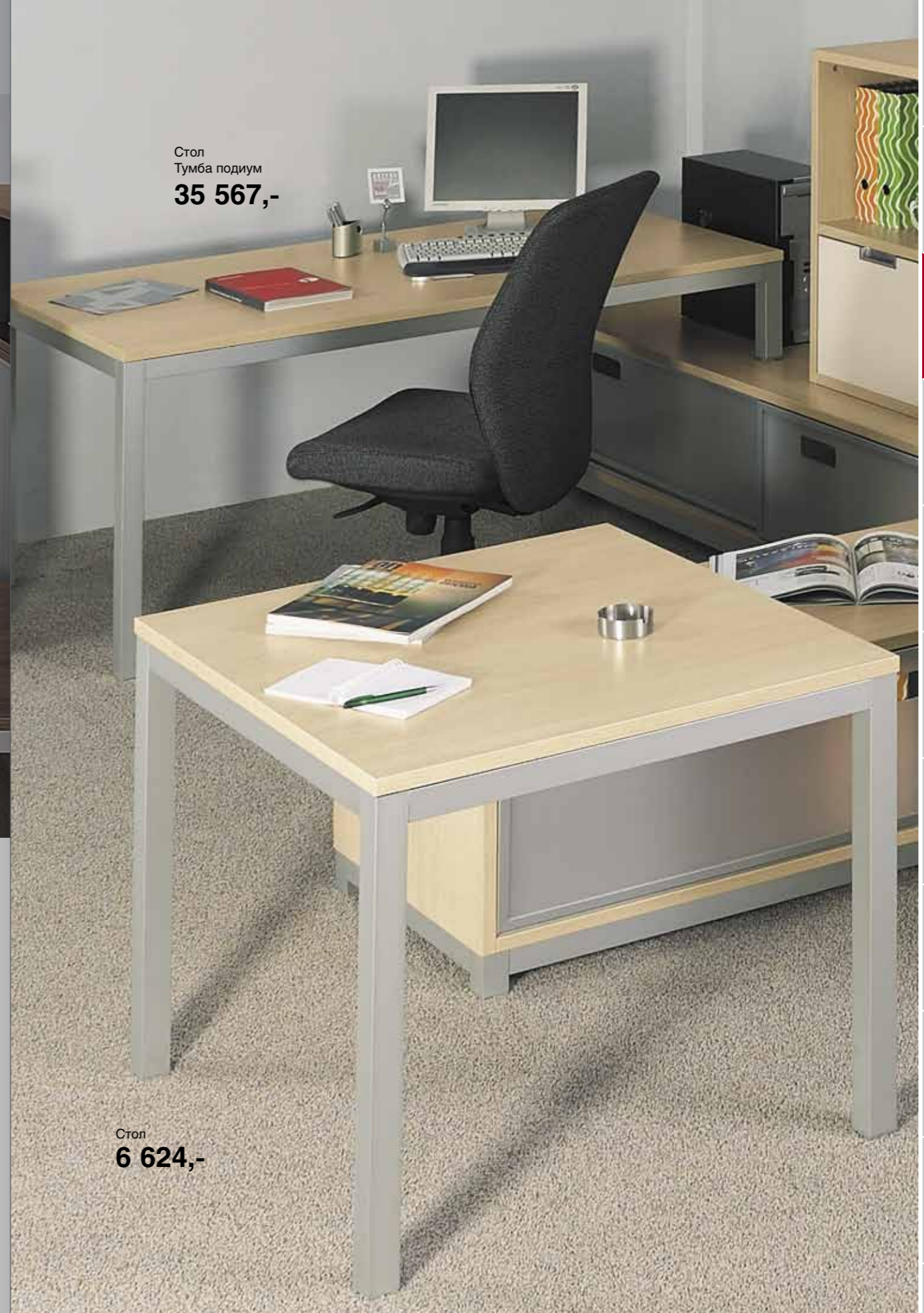
Стол Тумба подиум 35 567,-