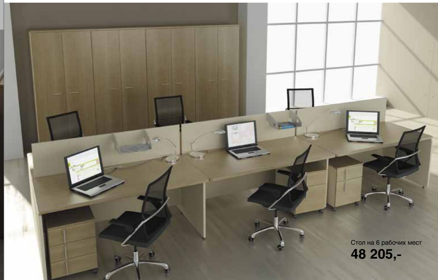
Стол на 6 рабочих мест 48 205,-