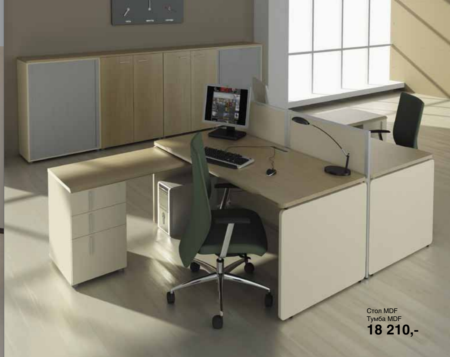
Стол MDF Тумба MDF 18 210,-

Мы рекомендуем к серии ACCORD перегородки серии FREE LINE