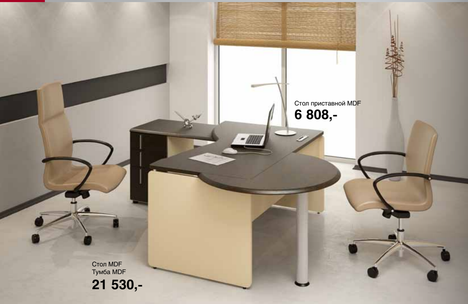
Стол приставной MDF 6 808,-