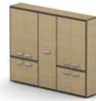
стеллаж широкий 197 382,-