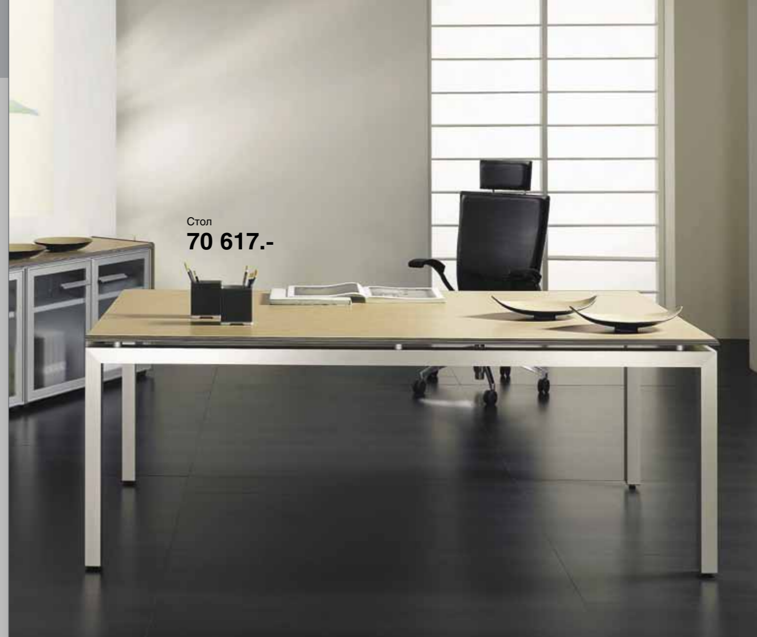
Стол 70 617,-

Вся мебель поставляется в разобранном виде, упакованная в гофрокартон и защитную пленку. Углы упаковки защищены накладками из ударопрочного пластика.