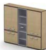
стеллаж широкий 192 921,-