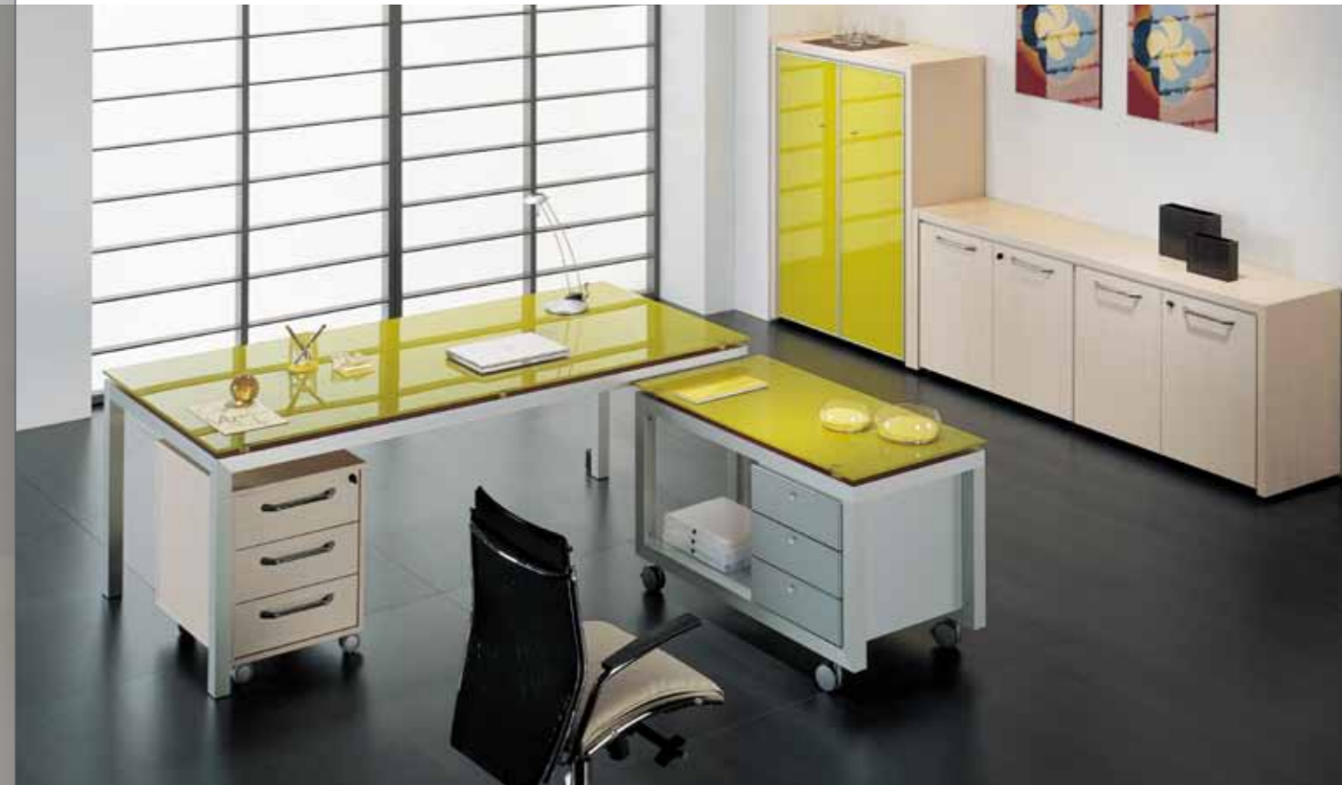
Тумба 80 627,-