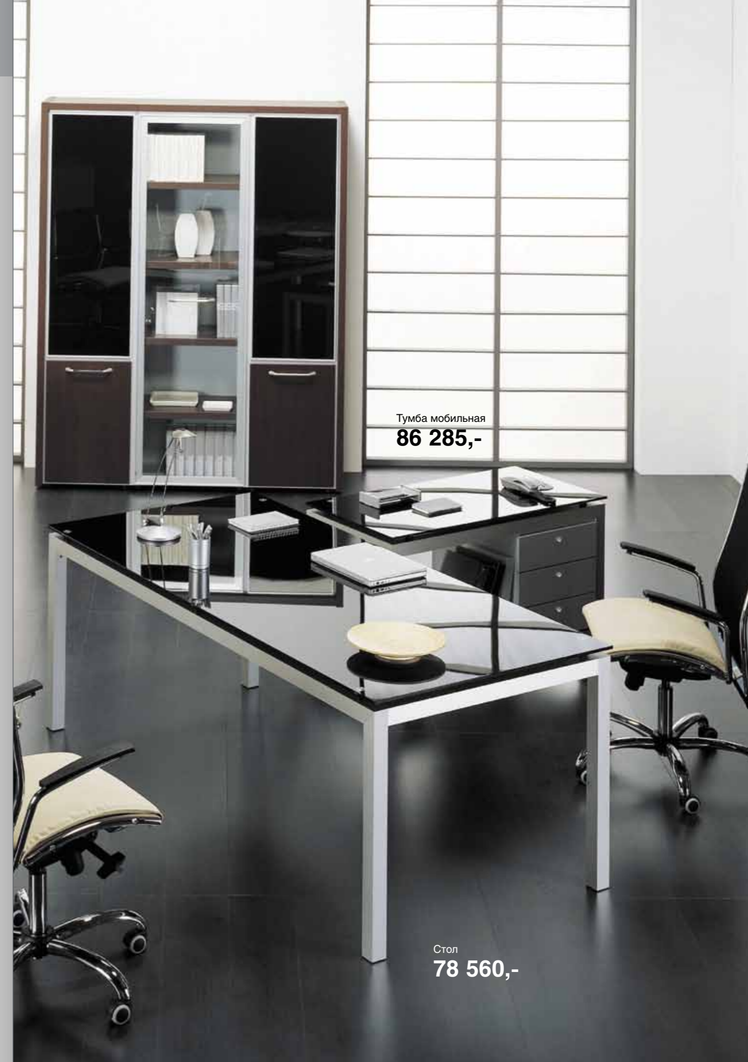
Тумба мобильная 86 285,-

Производитель оставляет за собой право замены отдельных элементов изделий на аналоги в соответствии с установленными параметрами качества продукции. Срок гарантии при этом остается неизменным.