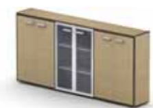
стеллаж широкий 177 034,-