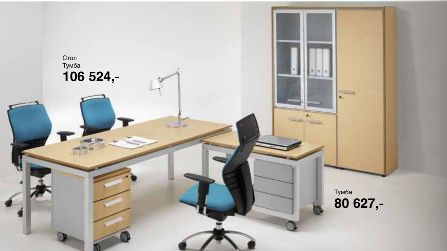
Стол Тумба 106 524,-