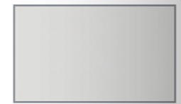
белый премиум *

* В цвете "белый премиум" могут быть выполнены фасады шкафов и тумб