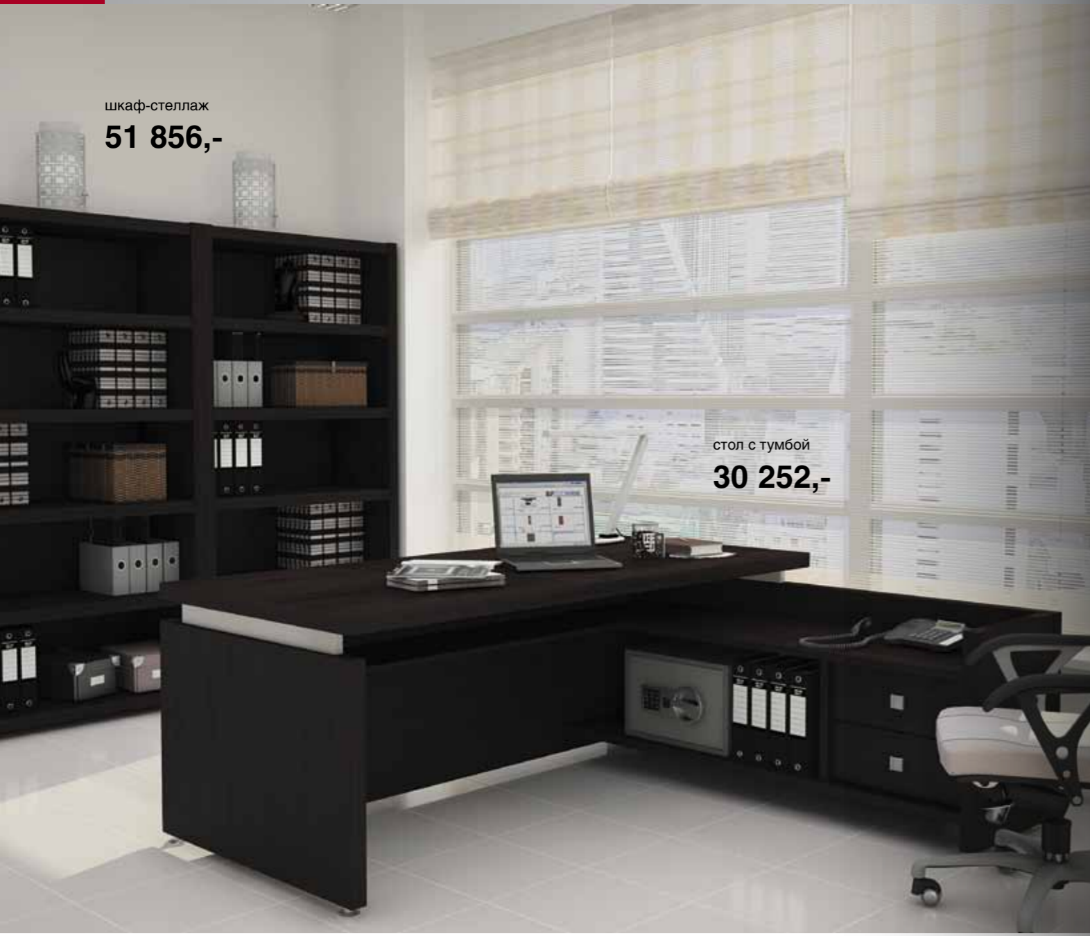
шкаф-стеллаж 51 856,-