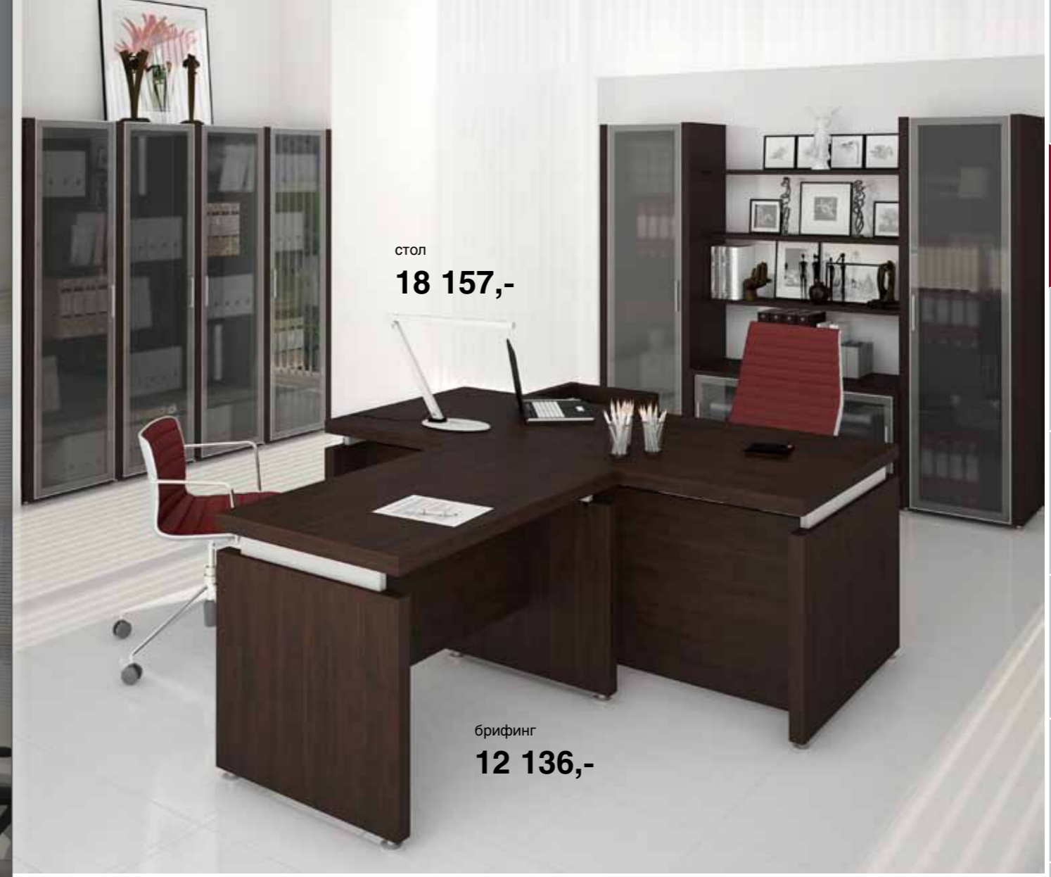
стол 18 157,-

Шкафы и стеллажи Боковые стенки шкафов и стеллажей изготовлены из 50 мм плиты "Евролайт" с кромкой 2 мм ABS. Полки и задняя стенка изготовлены из 18 мм ДСП с кромкой 2 мм ABS. В коллекции представлен стеллаж, в котором полки выполнены из 50 мм плиты "Евролайт" с кромкой 2 мм ABS. Глухие двери изготовлены из 18 мм ДСП с кромкой 2 мм ABS. Стеклопакеты в алюминиевой раме изготовлены из тонированного стекла цвета "графит" толщиной 4 мм. Упаковка и сборка Вся мебель поставляется в разобранном виде, упакованная в гофрокартон. Углы упаковки защищены пластиковыми накладками из ударопрочного пластика. Для быстрого и простого соединения деталей применяются новые виды соединительной фурнитуры для плиты "Евролайт" немецкого производства.