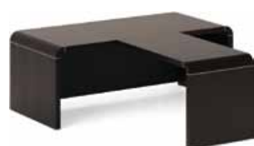
стол с брифингом 139 822,-