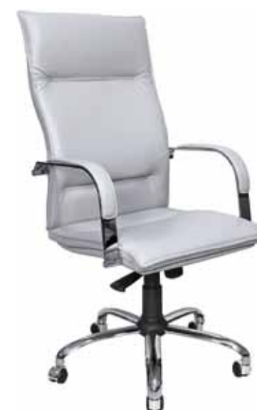
BERLIN P 25 016,-

Мы рекомендуем к серии MADRID GRANDE кресло: