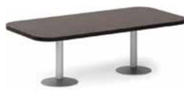
2 окончание стола 90 332,-