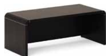
стол 94 596,-