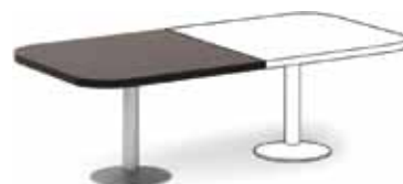
окончание стола 45 166,-