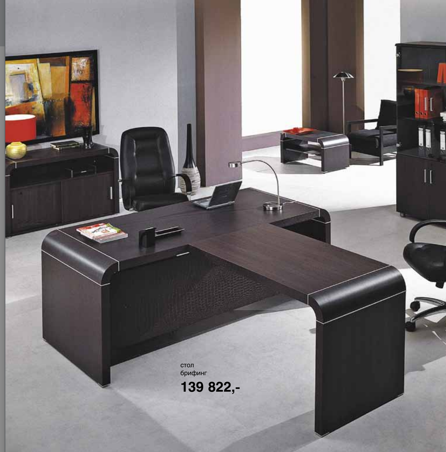
стол брифинг 139 822,-