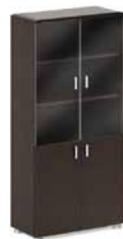
шкаф-витрина 34 416,-