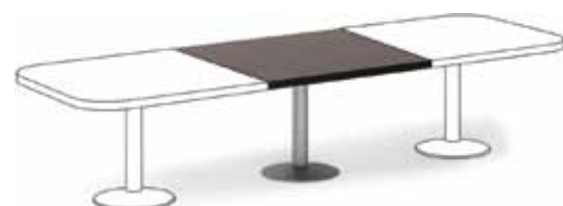
центральный элемент 41 862,-