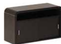
приставка 59 280,-