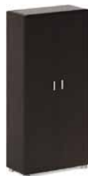
гардероб 33 694,-