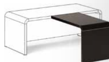
брифинг 45 226,-