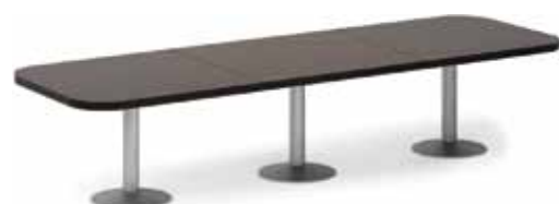
1 центральный элемент 2 окончание стола 132 194,-