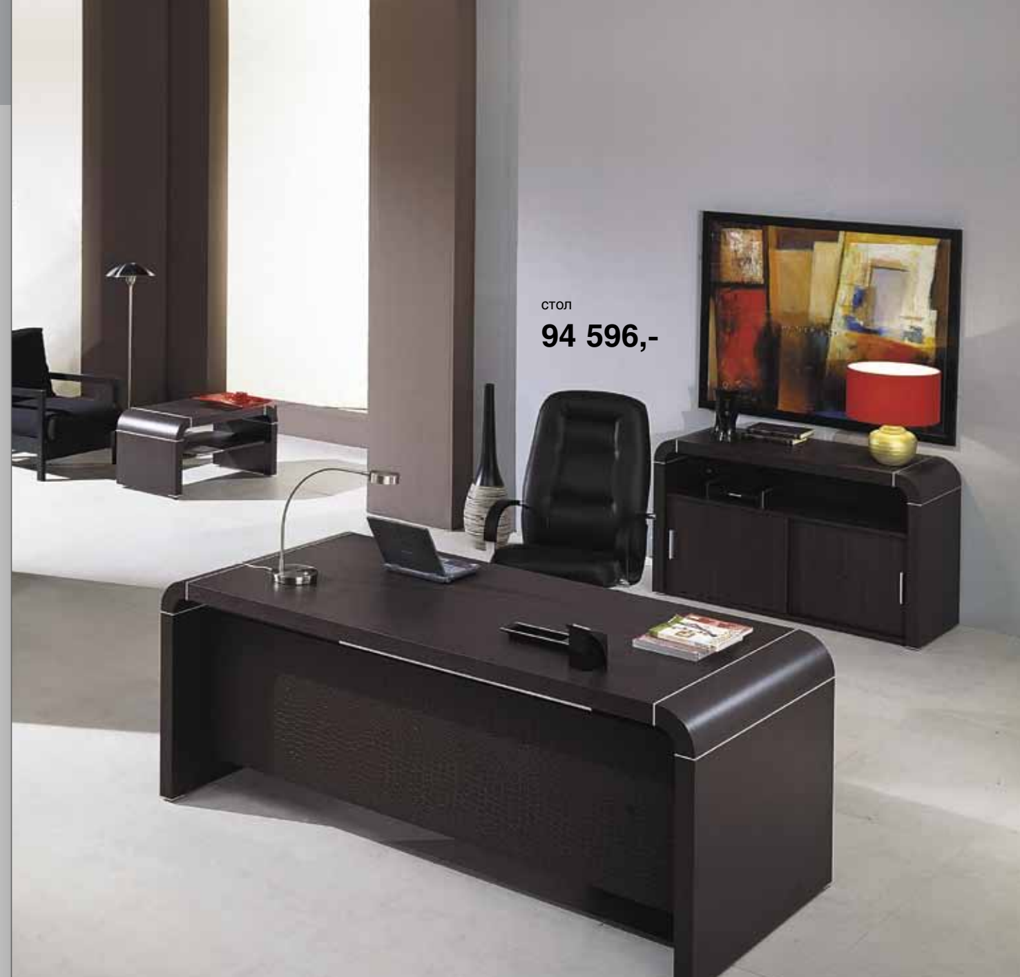
стол 94 596,-

Мы рекомендуем к серии MADRID GRANDE кресло: