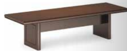
стол для переговоров 300x120 h76 117 326,-