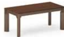
стол кофейный 120x60 h50 17 874,-