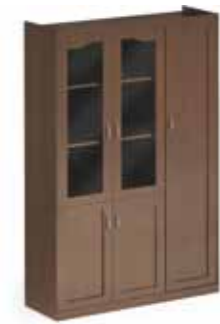
шкаф со стеклом + гардероб 136x45 h200 67 372,-