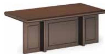
стол письменный 200x100 h78 57 118,-