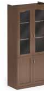
шкаф со стеклом 86x45 h200 48 066,-