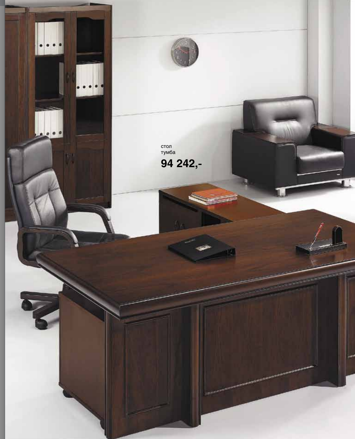
стол тумба 94 242,-

Производитель оставляет за собой право замены отдельных элементов изделий на аналоги в соответствии с установленными параметрами качества продукции. Срок гарантии при этом остается неизменным.