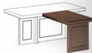
стол брифинг 120x80 h78 33 972,-