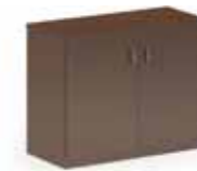
шкаф низкий 90x45 h73 27 728,-