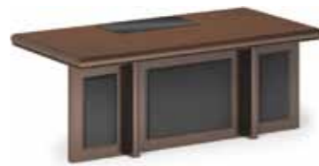
стол письменный с кожанной вставкой 200x100 h78 77054,-