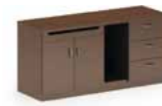
тумба приставная 130x45 h61 37 124,-